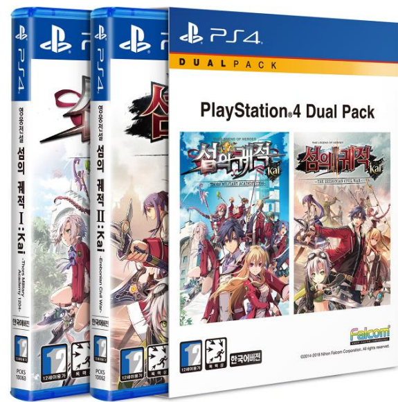
閃の軌跡エントリーパック (ハングル版)