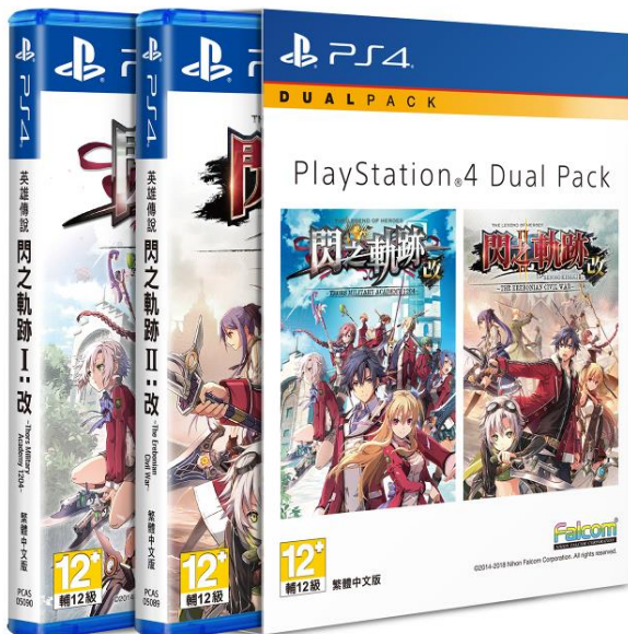
閃の軌跡エントリーパック (繁体字中国語版)

日本ファルコム株式会社(代表取締役社長:近藤季洋)は、ソニー・インタラクティブエンタテインメント(SIE)ローカライズセンターが手掛けるPlayStation®4用タイトル『英雄伝説 閃の軌跡 I:改 -Thors Military Academy 1204-』、『英雄伝説 閃の軌跡 II:改 -The Erebonian Civil War-』の繁体字中国語版およびハングル版について、同2作品をセットにしたお買い得パッケージ商品『閃の軌跡エントリーパック』が2019年1月17日(木)に発売されることをお知らせいたします。